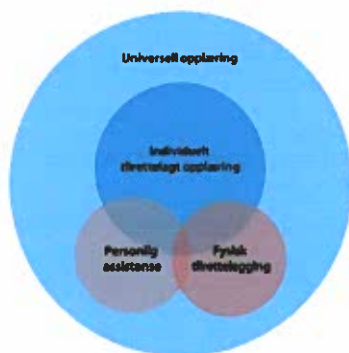
Figur 1 NOU 2019 23 Ny opplæringslov

Arbeidet med ny opplæringslov pågår, og det er forventet en høring på forslag til ny opplæringslov høsten 2021. Forskrifter forventes å komme på høring høsten 2022, og ny opplæringslov skal ha virkning fra høsten 2023. Sentrale begreper brukt i NOU 2019 23 Ny Opplæringslov vil med stor sannsynlighet bli gjeldende.