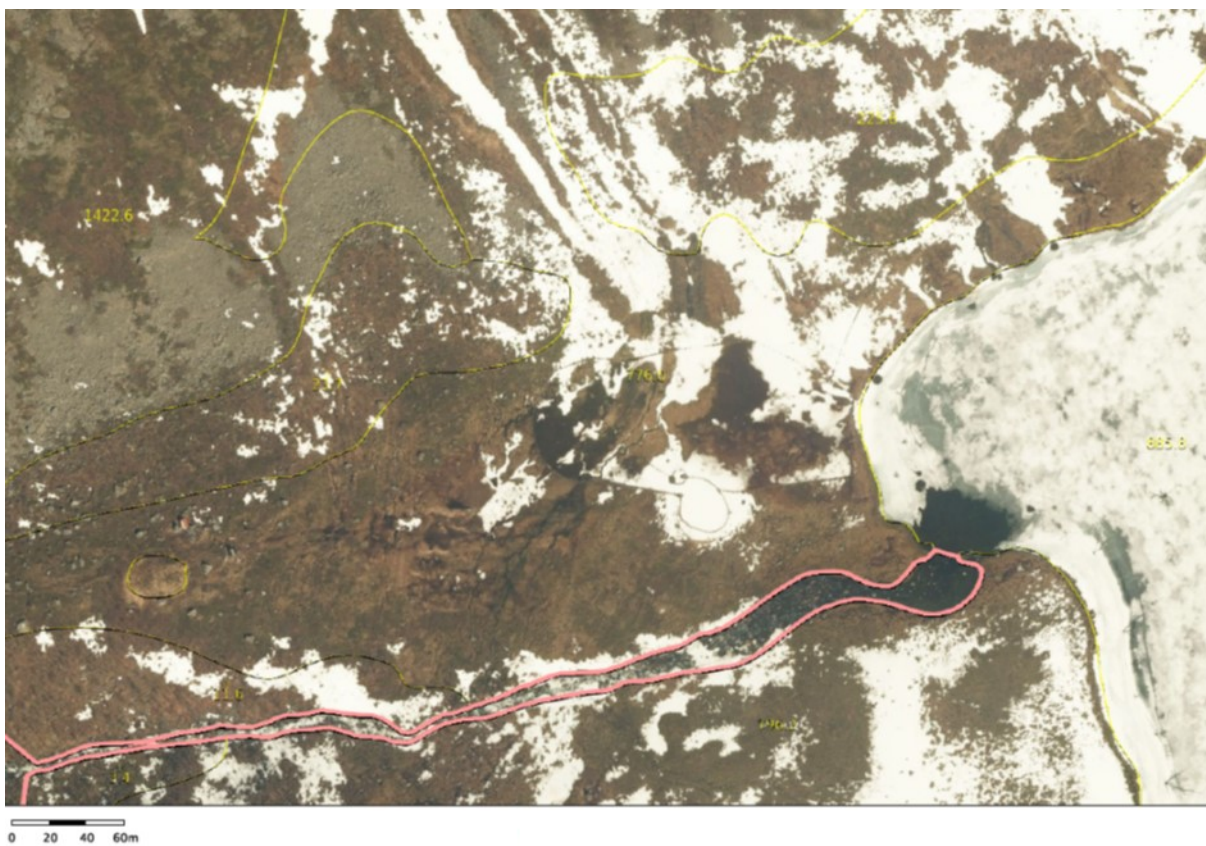
Tidligere gjerdeplass til venstre i bildet, og nåværende gjerde midt på bildet og ved vannkanten.