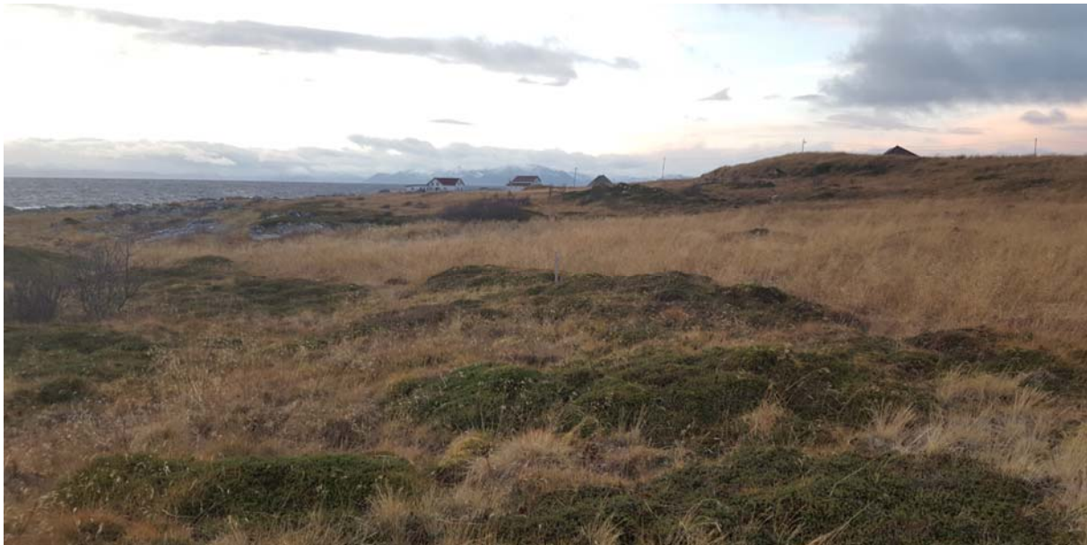
Bildet er tatt fra ca. midt i hyttefeltområdet F24.

Nordlig del av området vil bli direkte berørt – stengt for fri ferdsel. Resterende området vil få indirekte påvirkning i form av den visuelle endringen som fører med utbygging. Det er lite sannsynlig at området utenfor reguleringsplanen vil ellers få nedsatt verdi som nærturterreng. Generelt kan man si at visuell påvirkning vil bli forminsknet desto lengre fra planområdet man befinner seg.