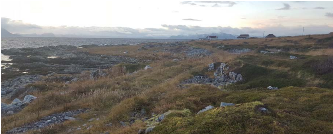
Bildet viser tidligere anleggsvei.

Utbygging av vindmølle og frakting av stein til småbåthavn etterlot sine spor. Rester av anleggsveier brukes i dag som turstier.