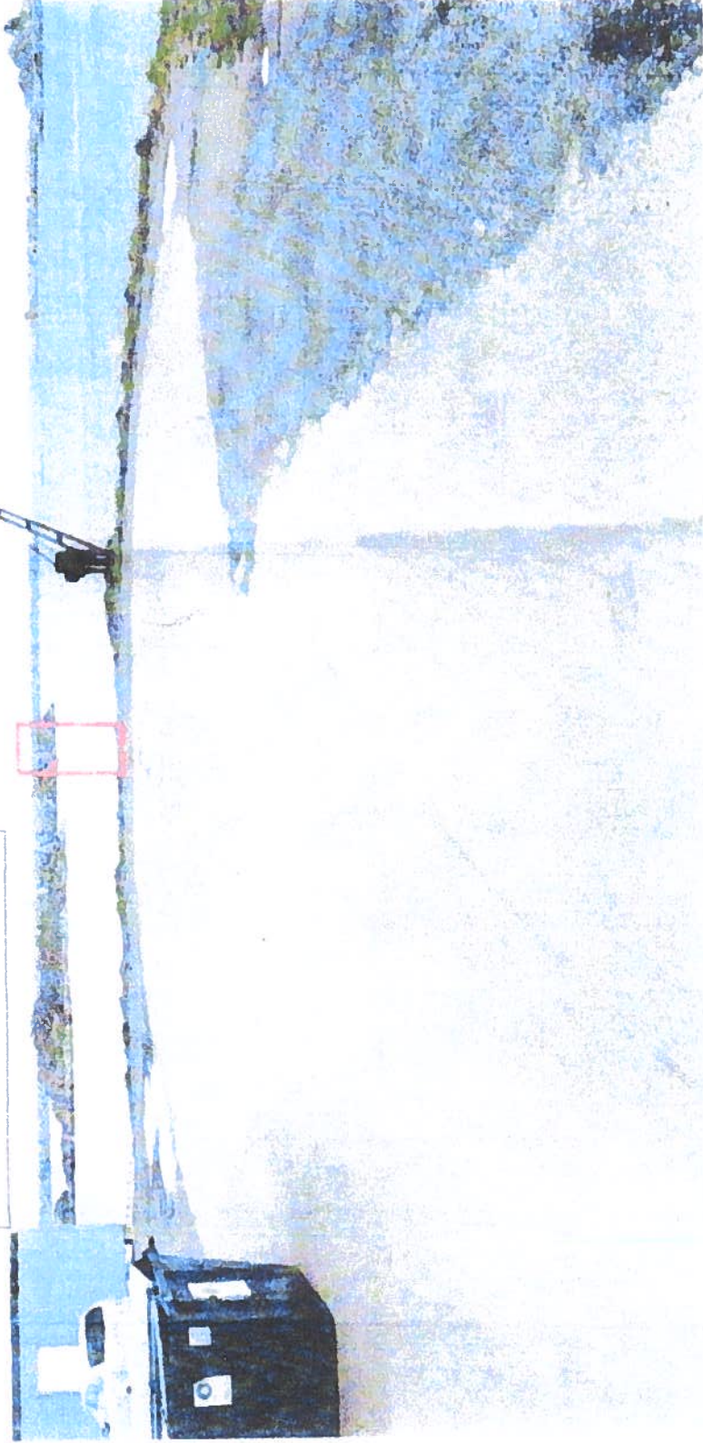
Fra Google – Street View Området sett ut mot vestre havn. Skulpturen tenkes satt så langt ut mot kanten av muren som mulig, men plasseres slik at det gir adgang til for å gå rundt skulpturen. Det er satt opp avgrensning for system