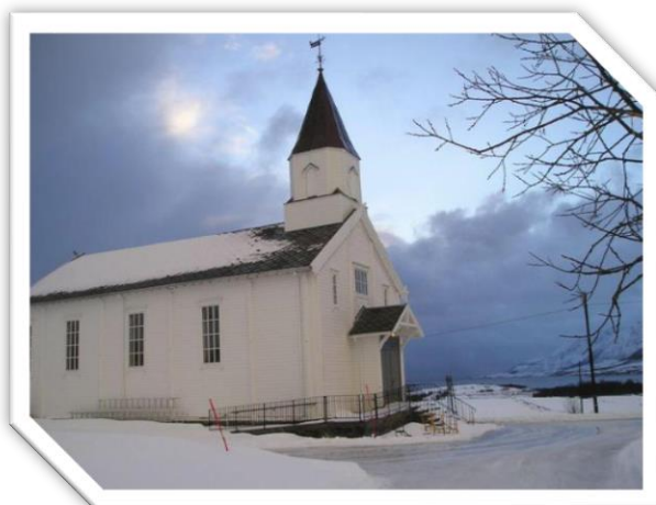
Bjørnskinn kirke i vinterdrakt

Det er regelmessige stabsmøter hver 14. dag, der alle ansatte er samlet. Det brukes tid på at hver får si litt om det den enkelte har vært igjennom siden sist og hva som ligger foran. Vi er en «gjennomsløst» gruppe medarbeidere som opplever å tilhøre et arbeidsfellesskap der ikke noe hverken er for stort eller for lite å dele. Utdringer og «nedturer» skal ikke ligge lenge urørt. Også det å snakke om de positive tingene er svært viktig.