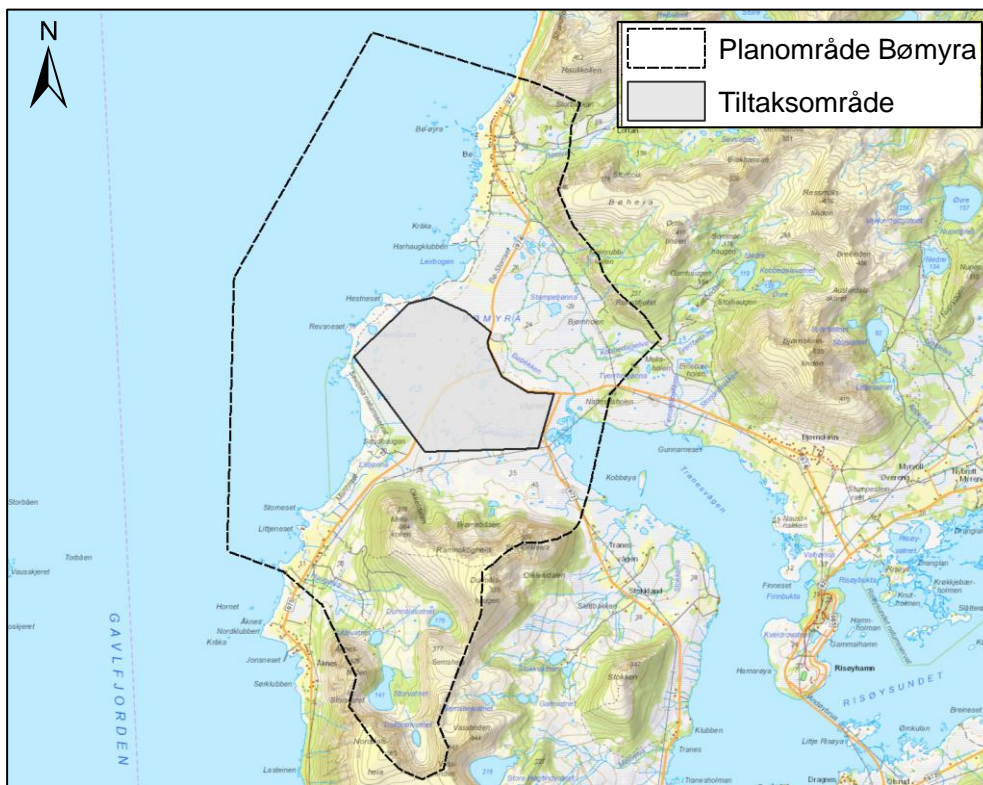
Kart 3 Planområde og mulig tiltaksområde.