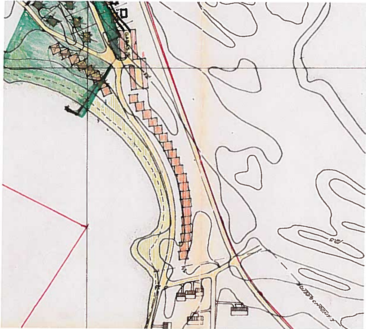
KARTUTSITT AV REGULERINGSPLAN.